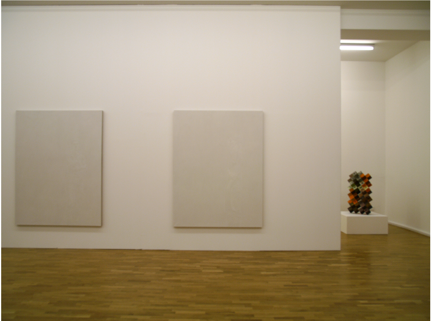
installation view, untitled nr. 4 and nr. 5, 2007, oil on linen, 168 x 128 cm to the right work by Tomohide Kameyama