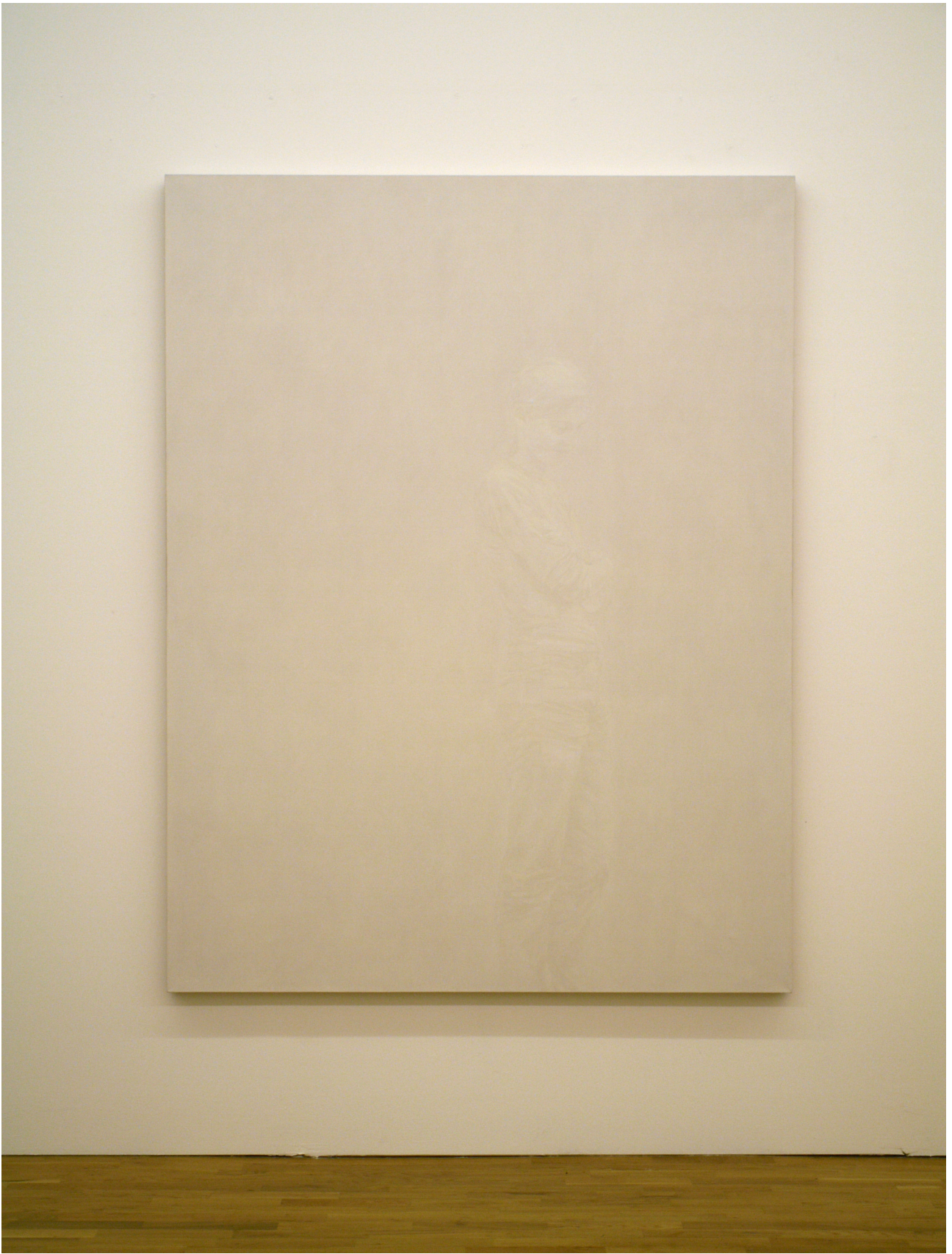
sans titre n°2, 2008., oil on linen, 168 x 128 cm