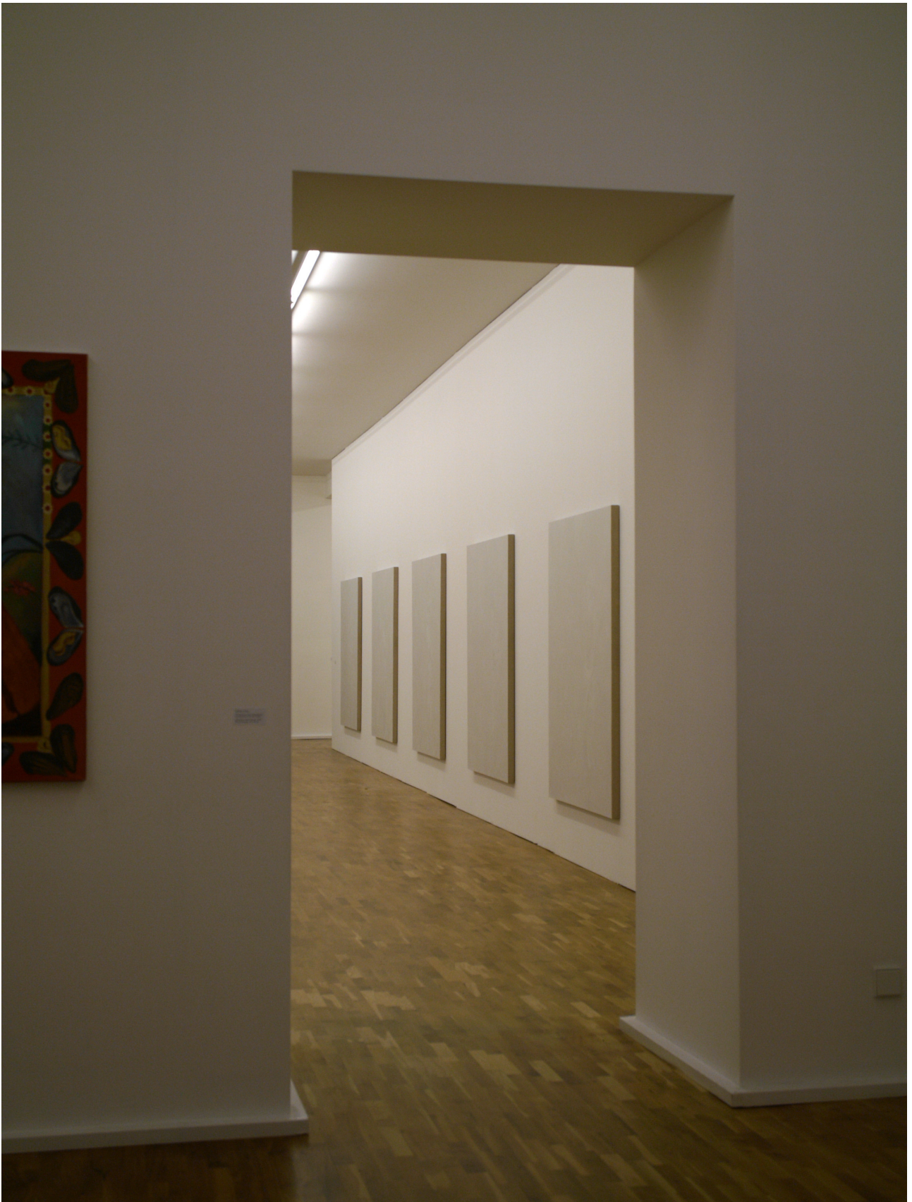
installation view, untitled nr. 1 - nr. 5, 2007, oil on linen, 168 x 128 cm foreground partial view of painting by Christy Astuy