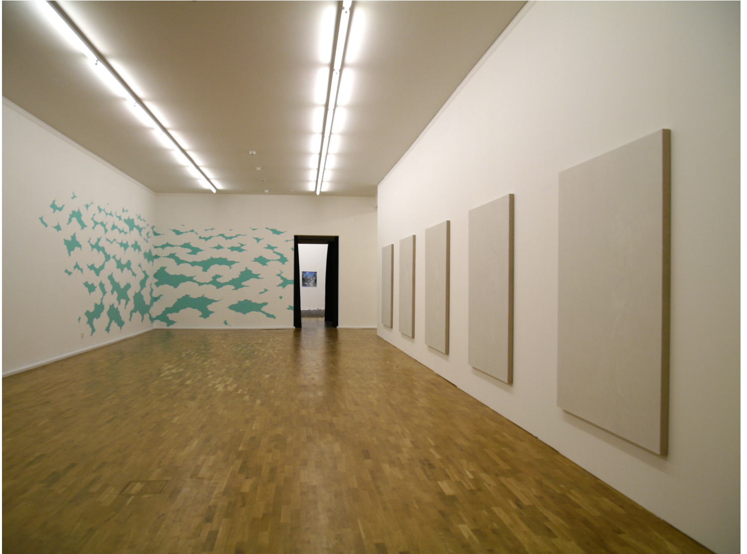
installation view, untitled nr. 1 - nr. 5, 2007, oil on linen, 168 x 128 cm to the left installation by Nami Yamamoto, next room work by Hendrikje Kühne and Beat Klein