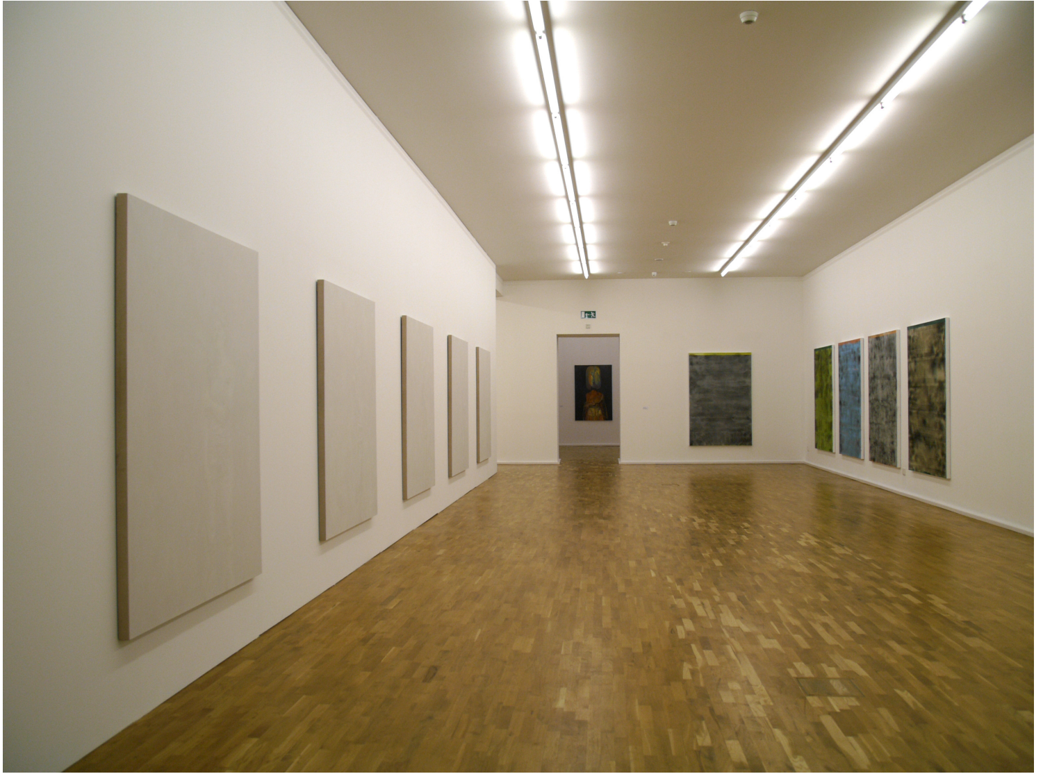
installation view, untitled nr. 1 - nr. 5, 2007, oil on linen, 168 x 128 cm to the right paintings by Dirk vander Eecken next room paintings by Christy Astuy