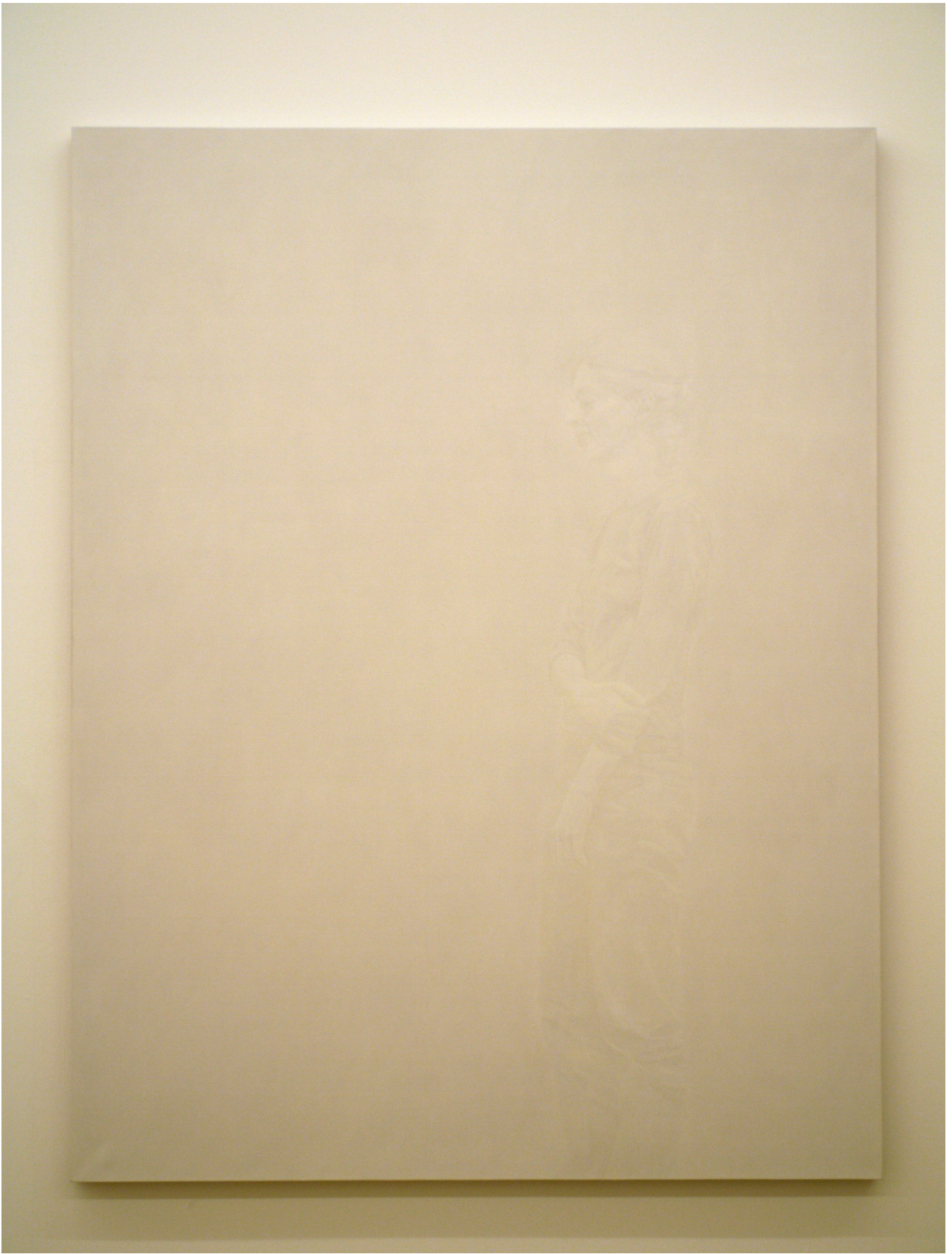
sans titre n° 5, 2007, oil on linen, 168 x 128 cm