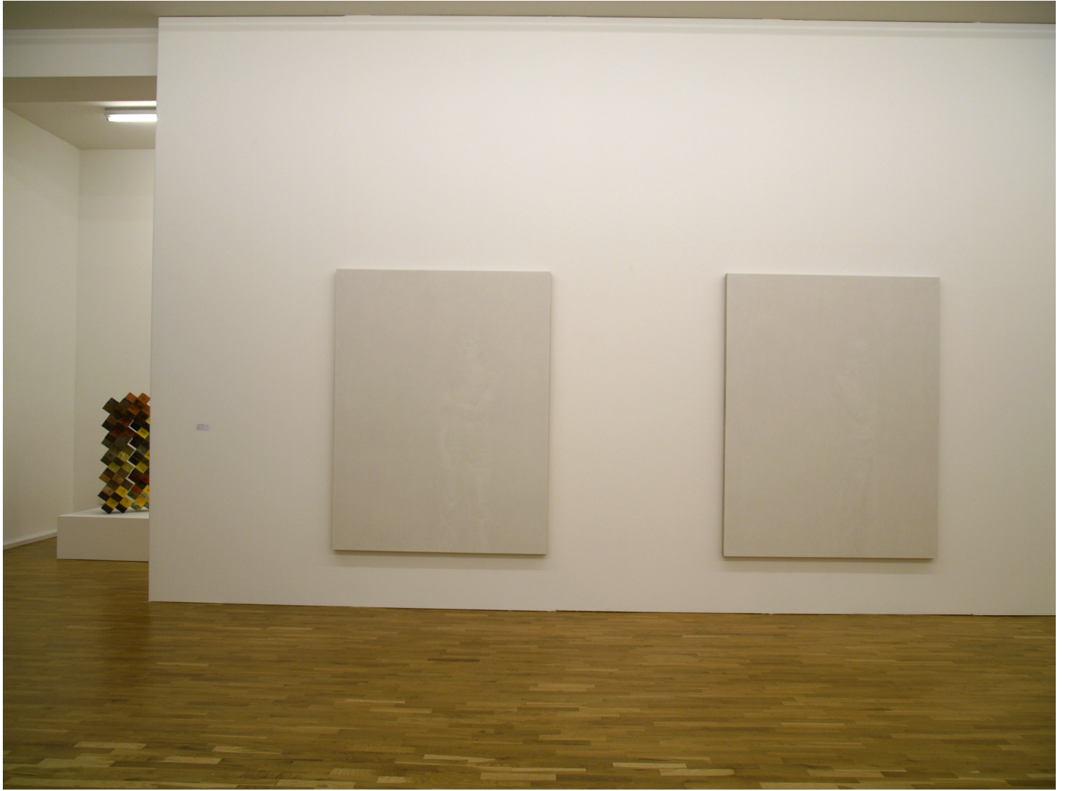
installation view, untitled nr. 1 and nr. 2, 2007, oil on linen, 168 x 128 cm to the left work by Tomohide Kameyama